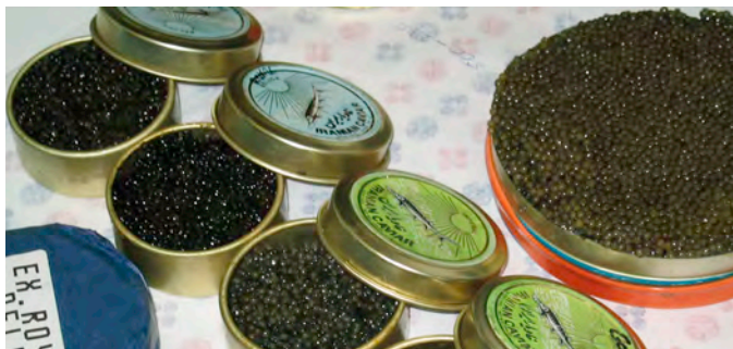
BELUCA CAVIAR

➤ Dezvoltarea unui program educational care să vină în sprijinul unei mai bune informări și formări a tinerilor viitori pescari ai Dunării.