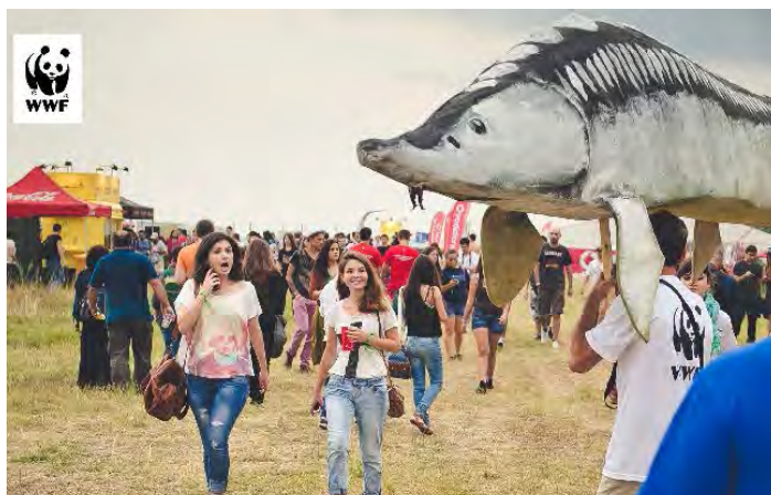
STURGEON - BESTFEST